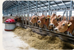
12 новых молочнотоварных ферм