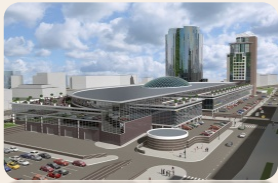
9 многофункциональных комплексов