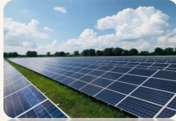
2 фотозлектрические станции