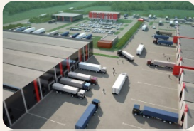
1 логистический центр