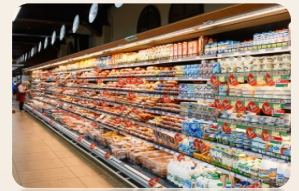
71 торговый объект