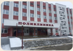
4 амбулаторно- поликлинические организации