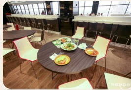
8 объектов общественного питания