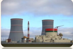
Первый энергоблок атомной электростанции