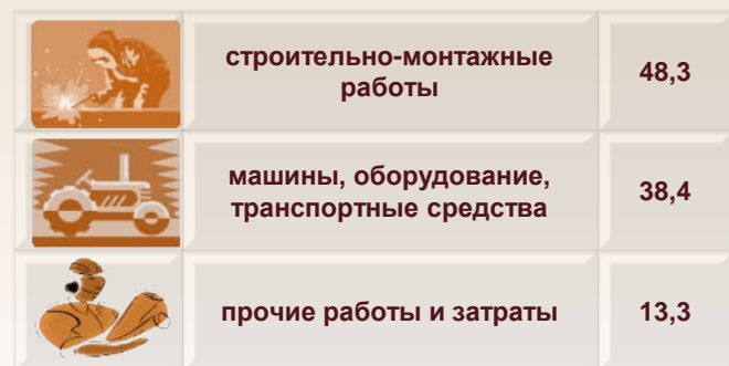
Технологическая структура инвестиций в основной капитал (в % к общему объему инвестиций)