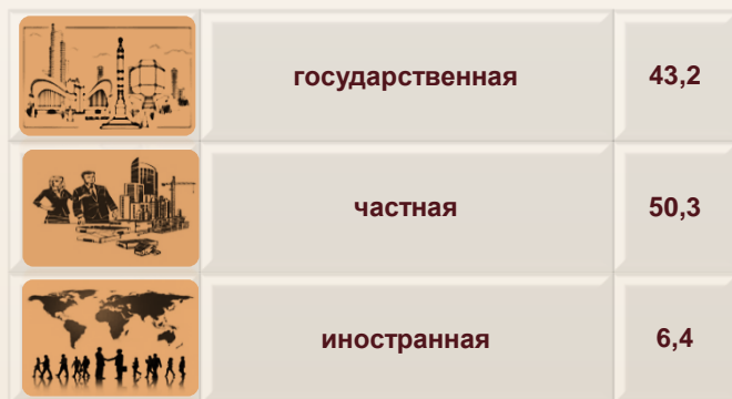
Технологическая структура инвестиций в основной капитал (в % к общему объему инвестиций)