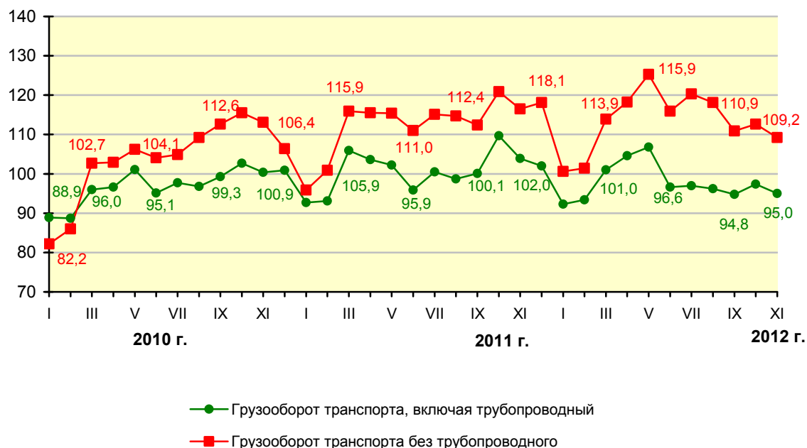
Динамика грузооборота транспорта в % к декабрю 2009 г.