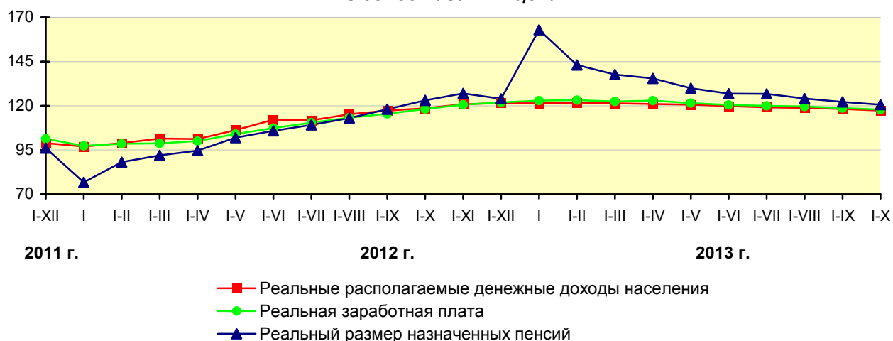
Динамика основных показателей реальных доходов населения в % к соответствующему периоду предыдущего года; в сопоставимых ценах