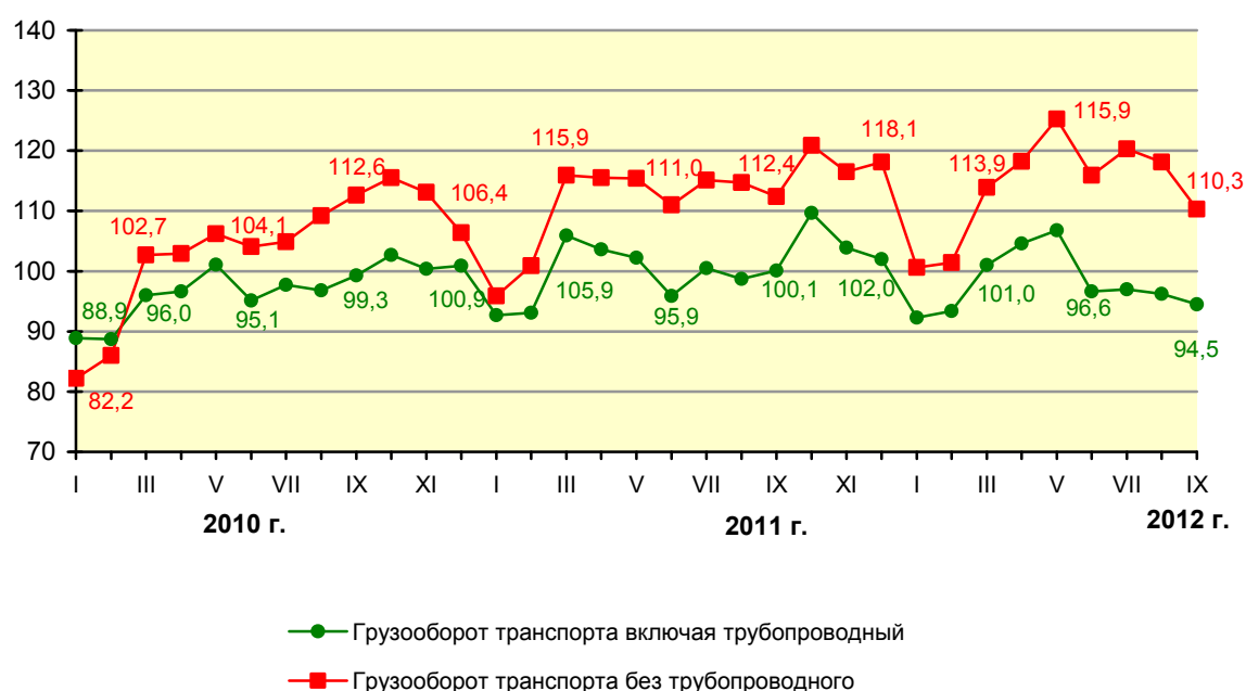
Динамика грузооборота транспорта в % к декабрю 2009 г.